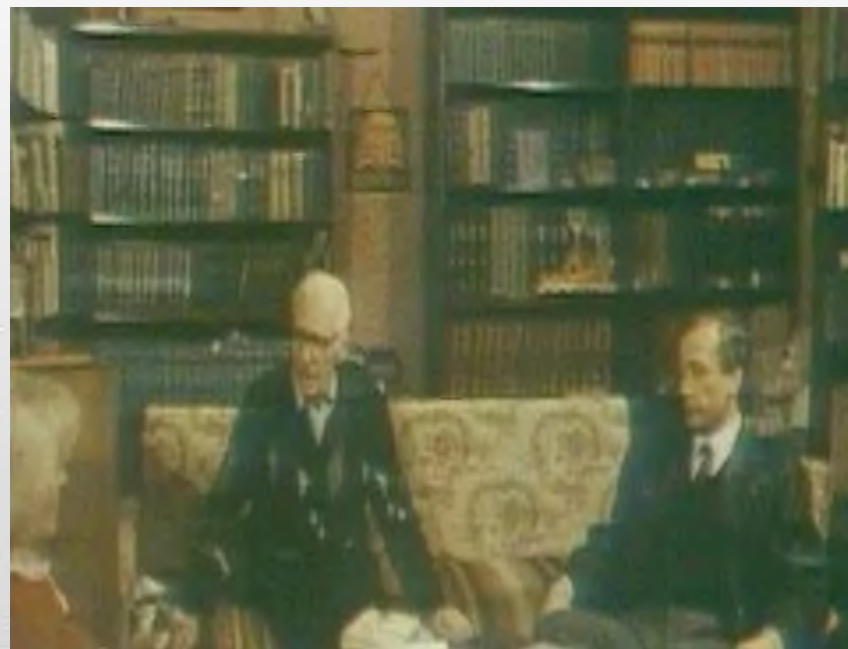
Отец писателя и сатирика Михаила Задорнова (1948—2017).